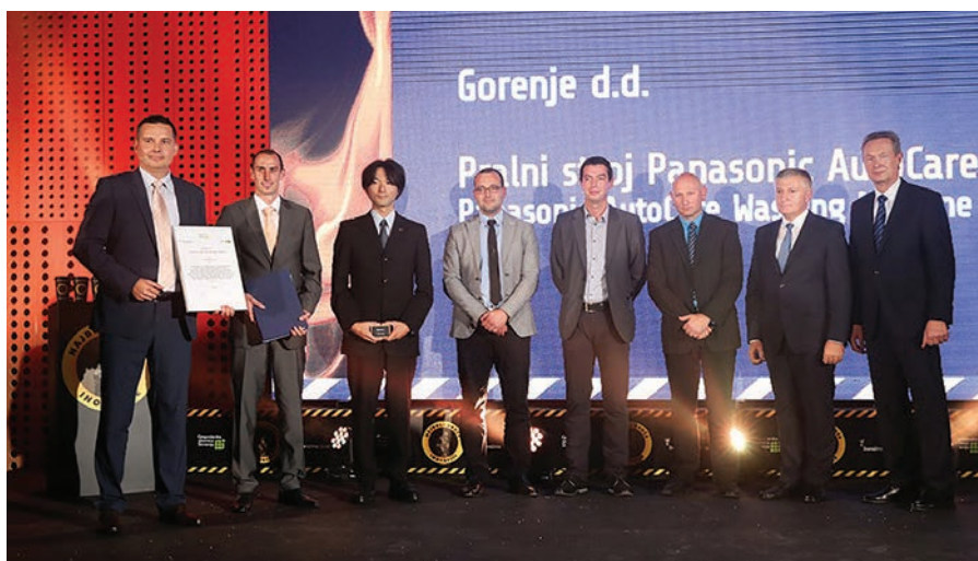
Inovatorji Gorenja so prejeli zlato priznanje za pralni stroj Panasonic AutoCare.

Inovatorji BSH Hišnih aparatov so prejeli zlato priznanje za popolnoma avtomatski kavni aparat EQ.9 in kompaktni kuhinjski aparat MultiTalent 3, inovatorji Gorenja pa za pralni stroj Panasonic AutoCare.