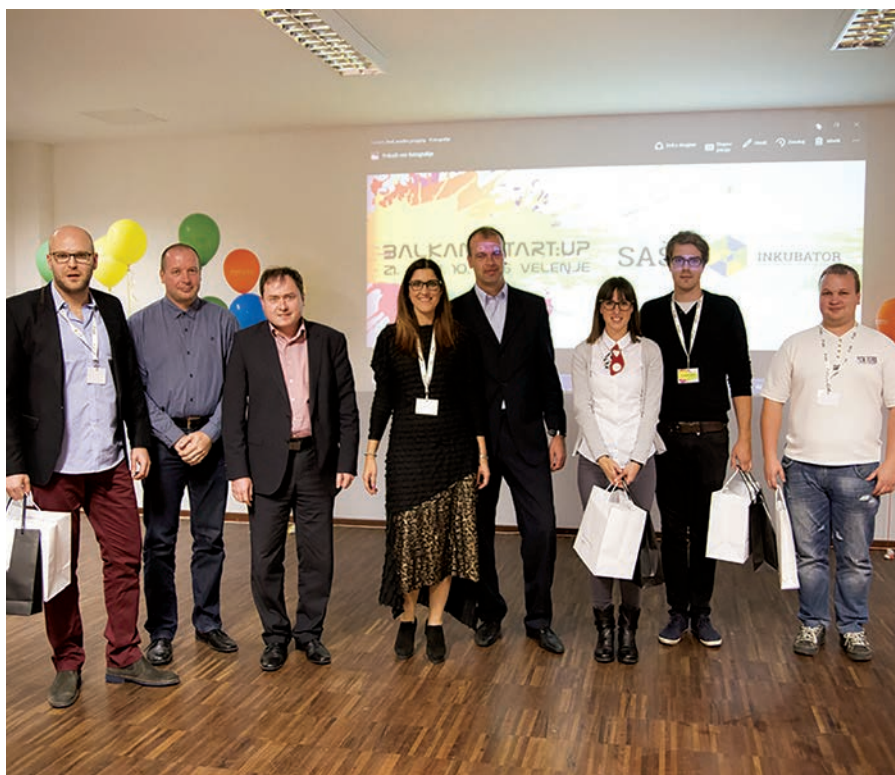
Strokovna komisija in nagrajenci po razglasitvi rezultatov

Tudi nagrada za tretje mesto je ostala doma. Kravljček je ženski modni dodatek, ki stopa ob bok moškim elegantnim kravatam. Gre za ročno narejen izdelek iz vrhunskih materialov in unikatnega izgleda. Kravljček se najbolje počuti v poslovnem okolju, sestankih in poslovnih prezentacijah, najbolje pa se poda ženskam, ki želijo izstopiti iz sivine vsakdanjih dolgočasnih modnih dodatkov.