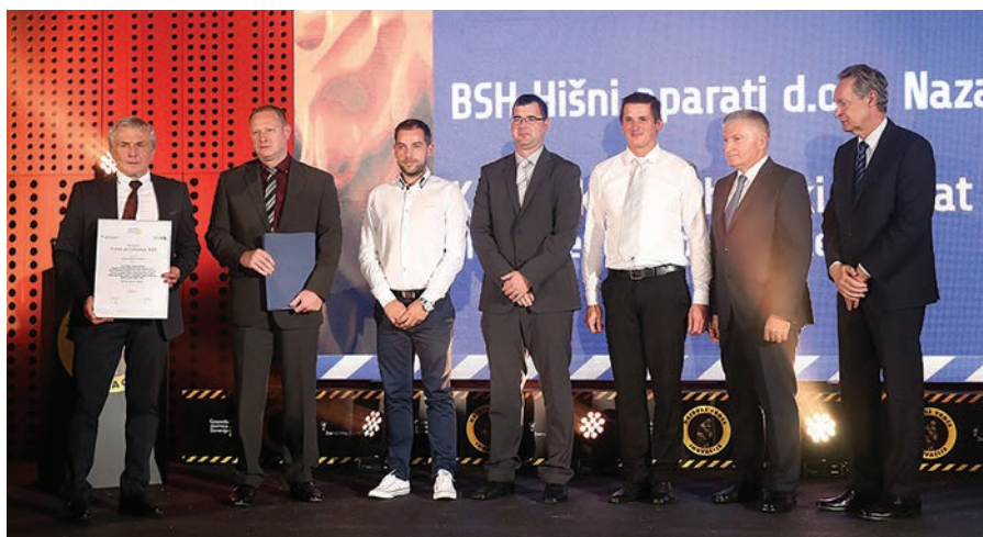
Nagrajeni inovatorji BSH Hišnih aparatov za kompaktni kuhinjski aparat MultiTalent 3

Prejemniki zlatih priznanj so svoje inovacije predstavili na poseben, kreativen način – v obliki 3-minutnega govora v angleškem jeziku. Na ta način so se predstavili ne le slovenski, temveč tudi tujim javnostim. V ta namen so bili na dogodku prisotni tudi predstavniki 15 tujih diplomatsko konzularnih predstavništev, ki pokrivajo Slovenijo. Hkrati so nekatera slovenska velepo-