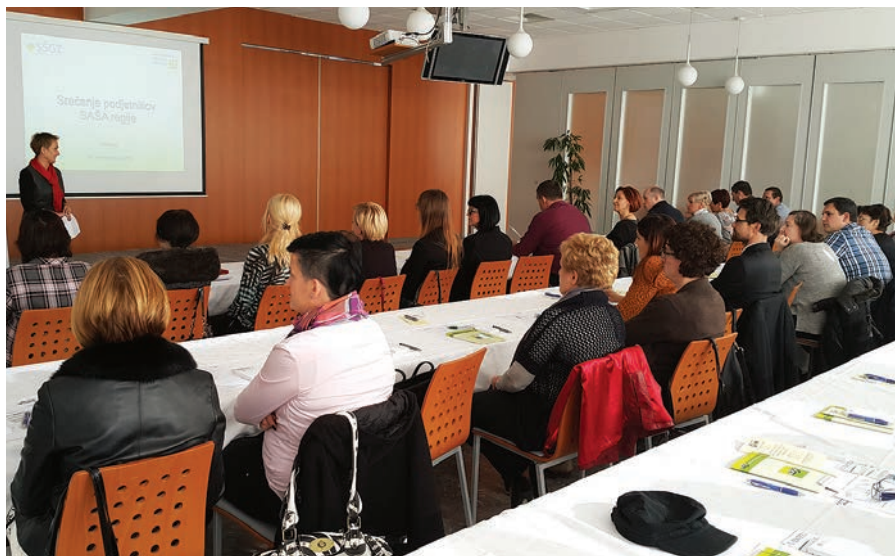
Regijsko srečanje podjetnikov je postalo že tradicionalno.