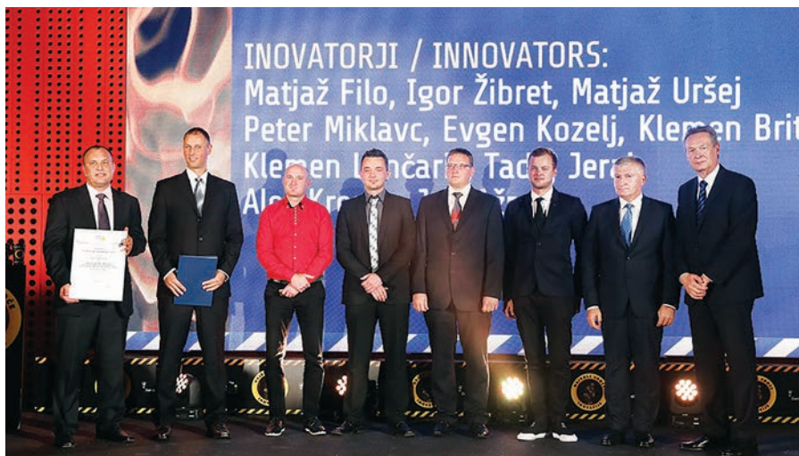
Drugo zlato priznanje so prejeli inovatorji BSH za popolnoma avtomatski kavni aparat EQ.9.