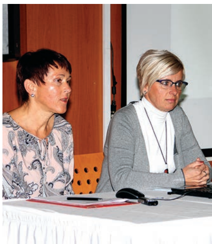
Predstavnici finančnega urada sta predstavili učinke uvedbe davčnih blagajn.