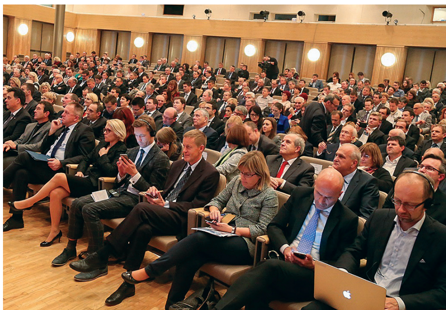
Udeleženci so iz DigitAgende 2016 izpostavili tri prednostna splošna in štiri prednostna specifična priporočila.