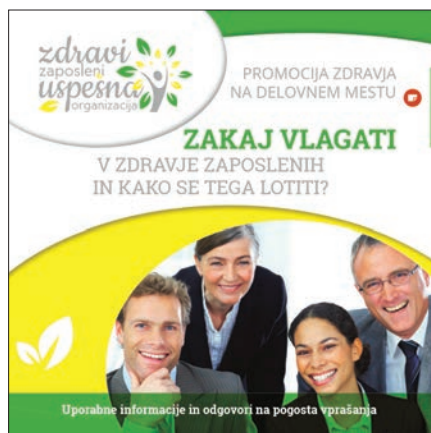
V sklopu projekta je bila izdana tudi knjižica z uporabnimi informacijami.